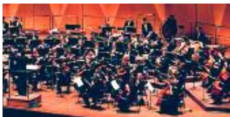
L'orchestre européen, un rendez-vous à ne pas manquer !