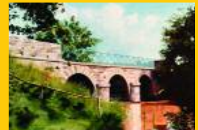
Paysage du pays vu par l'artiste