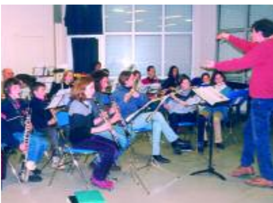
L'œuvre musicale, un des projets portés par le pays

Votre pays, espace de projets, soutient deux types d'action. Les projets internes, qui émergent dans les groupes de travail et suivent un parcours dans les différentes instances du pays. Mais aussi les projets présentés par des porteurs externes, si le pays est associé dès le démarrage à leur élaboration. Dans tous les cas, les projets doivent répondre aux orientations de la charte de développement (voir Information pratique).