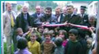
Les élus du pays, les représentants de l'Etat et de la Région étaient mobilisés

C'est le 21 novembre 2003 que ces nouveaux locaux ont été inaugurés. Cette action fait suite au fort essor démographique du Pays des vallons de Vilaine. Le groupe scolaire Camille Claudel fait partie des six projets d'aménagement de nouveaux locaux scolaires soutenus par la Région et le Programme régional d'aménagement du territoire, via le pays.