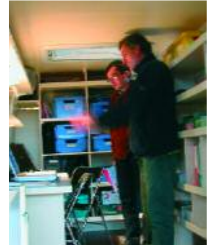
Formabus est équipé de 2 postes informatiques

Formabus, géré par l'Apparth (association promotionnelle pour l'autonomie et le reclassement des travailleurs handicapés) sillonne les communes du pays de Guichen et de Redon pour remobiliser les compétences des personnes les plus éloignées de l'emploi. Ce dispositif expérimental travaille en partenariat étroit avec les organismes d'insertion socioprofessionnelle. Formabus propose des formations pour amener les personnes vers les dispositifs de droit commun (emploi - formation).