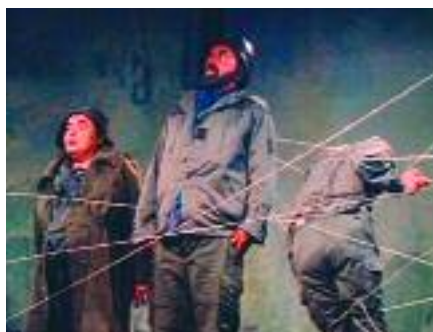
Le pays compte déjà plusieurs troupes de théâtre

Depuis septembre, 14 adolescents de Chanteloup et des environs, recrutés sur leur motivation pour le théâtre et la musique, se sont engagés dans la création d'une pièce de théâtre. Accompagnés par