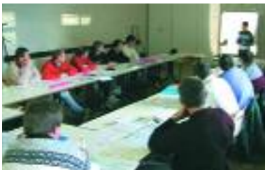
Des agriculteurs en formation

Au programme de la réunion plénière de la commission, le 11 décembre : l'état d'avancement des projets - comme la formation des agriculteurs au plan prévisionnel de fertilisation - le lancement des prochaines opérations et la finalisation de critères de choix pour les projets. Ce travail facilitera la mission des bureaux du conseil de développement et du pays, qui émettent un avis ou décident de la mise en œuvre des projets.