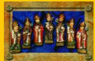
Les 7 saints fondateurs de la Bretagne