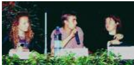
Les intervenants lors de la soirée débat

Dans le camp des responsables d'entreprise, un maître mot : la motivation. "Le bâtiment est demandeur de jeunes et s'ils sont motivés ce secteur offre des perspectives d'évolution que peu de professions peuvent offrir et ce dans les entreprises de toutes tailles. La qualification CAP BEP