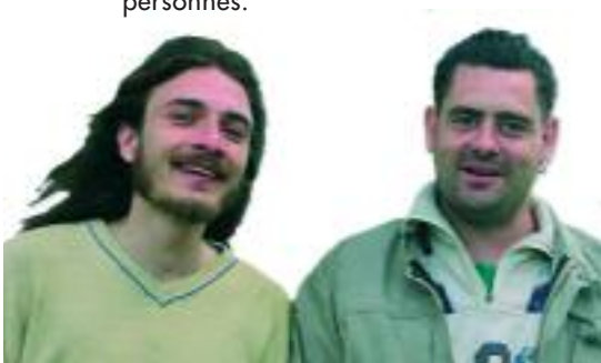
Les encadrants du chantier d'insertion de moyenne Vilaine et du Semnon

Dans le cadre de la semaine pour l'emploi des personnes handicapées, une réunion d'information sur l'insertion des travailleurs handicapés s'est tenue à Bourg des Comptes, à l'initiative de la commission services aux personnes.