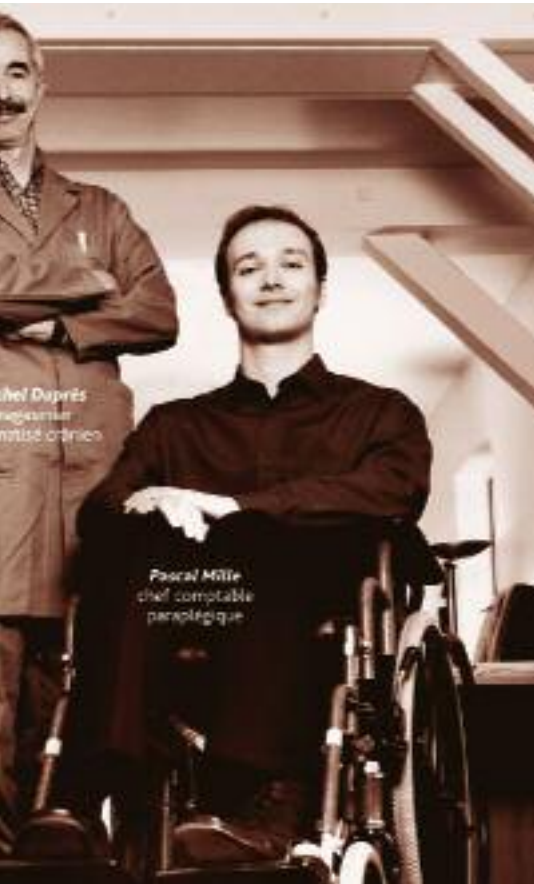
Affiche de la semaine pour l'emploi des personnes handicapées

mieux les missions confiées. Il leur est cependant difficile de trouver suffisamment de missions adaptées.