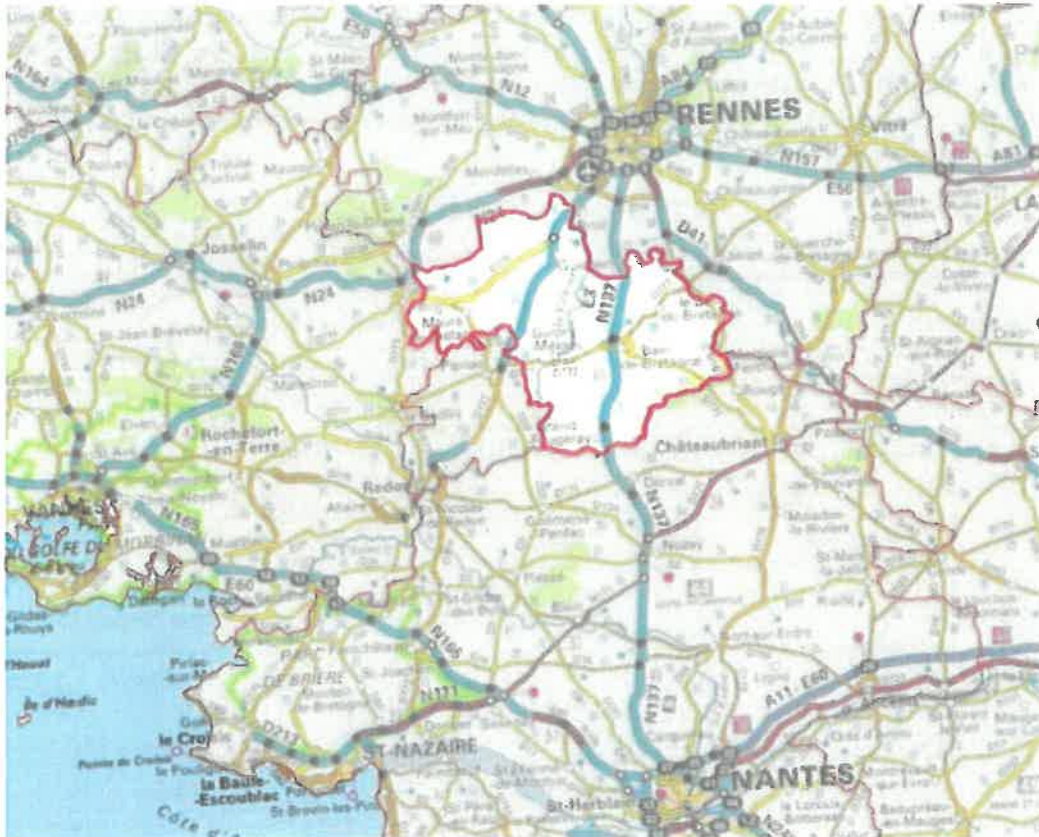
Carte : source dossier