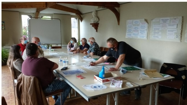
Ateliers de travail à Guichen le 03 juin