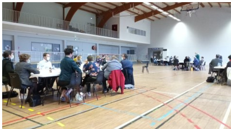
Ateliers CRTE le 20 mai à Guirpry-Messac