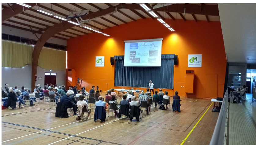
L'espace Claude Michel a été mis à disposition par la mairie de Guipry-Messac pour la conférence

Suite à la conférence, le conseil de développement souhaite produire un document de restitution synthétique permettant de mettre en exergue les enjeux liés à la préservation de l'eau, la biodiversité sur les territoires.