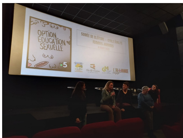
Photo prise lors de l'échange entre les 4 actrices du territoire

Lien vers l'article de Ouest-France annonçant l'événement : ICI