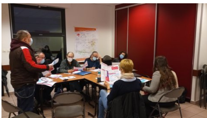
Photo prise lors d'un atelier de travail le 01 mars

Le conseil de développement a mis l'accent sur les réponses à apporter avec un focus particulier sur l'animation à venir du plan de mobilité simplifié.