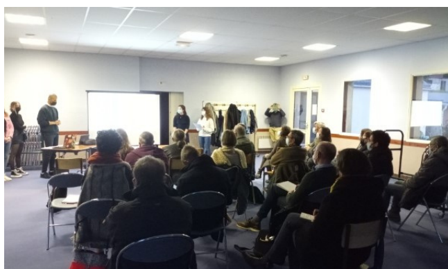
Photo prise à Saint-Senoux lors de la restitution