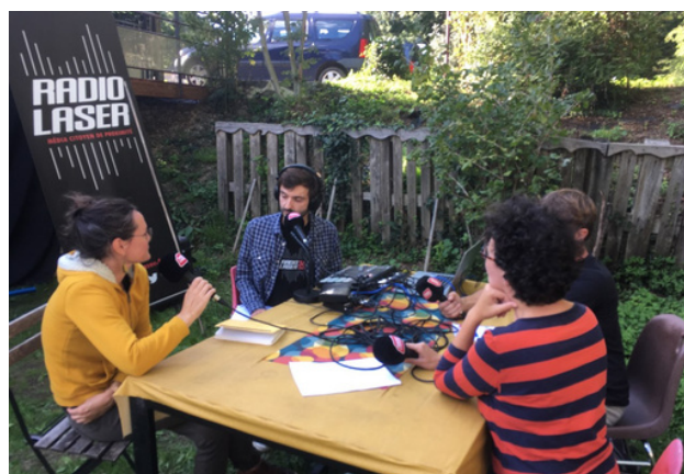
plateau Radio Laser