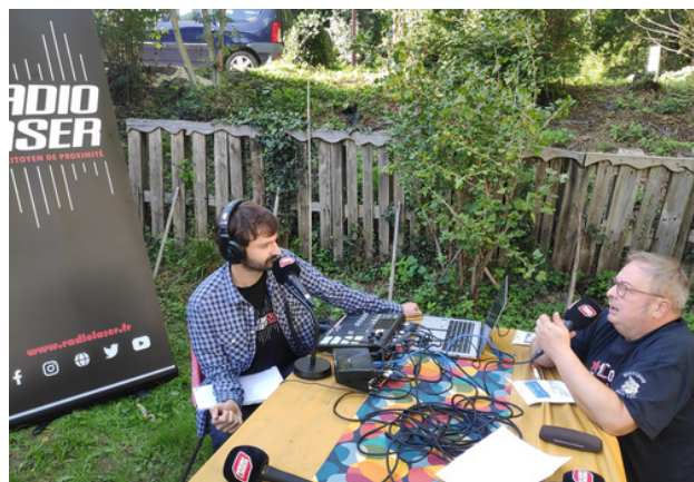
plateau Radio Laser