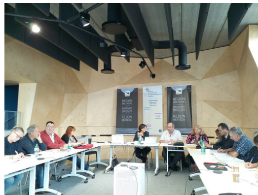
Le réseau des conseils de développement réuni à Brest