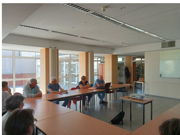
conférence sur le plastique