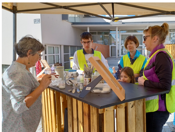
atelier fabrication de cosmétiques