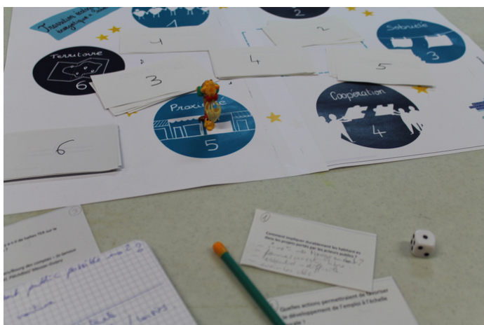
Ateliers participatifs du 06 septembre 2022 à Guipry-Messac

Le conseil de développement a également participé activement à l'atelier de co-construction organisé avec les acteurs de la société civile à Guipry-Messac le 06 septembre 2022 pour co-construire les fiches actions du futur programme européen LEADER 2023-2027.