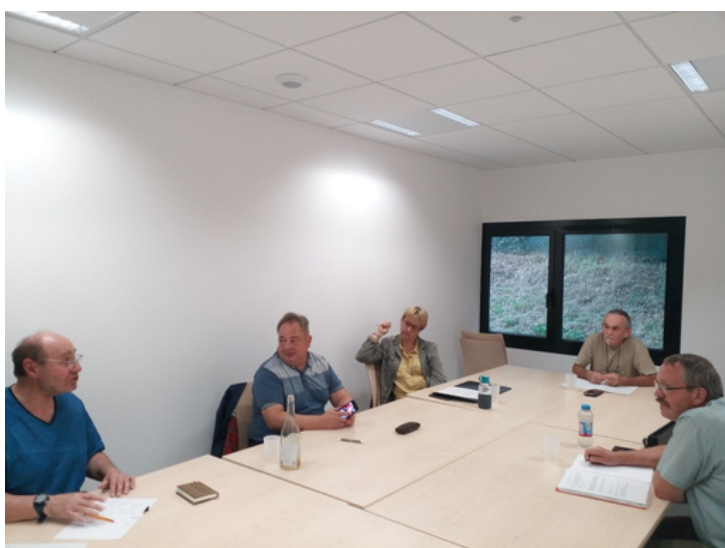
Les membres du conseil de développement rassemblés à Guichen

Le conseil de développement s'est réuni à deux reprises pour proposer quelques premières pistes de réflexion qui pourront être intégrées au dossier.