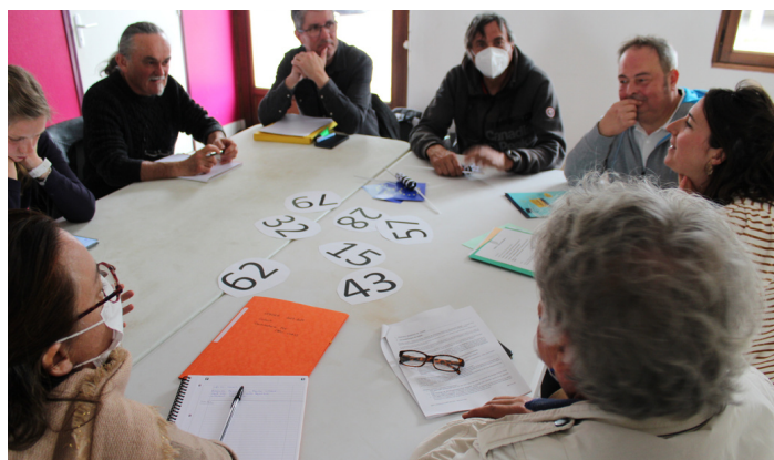
COPIL-COTECH LEADER à Guipry-Messac

Le conseil de développement a travaillé à deux reprises sur la notion d'innovation : sur sa définition ainsi que sur ce que sa finalité.