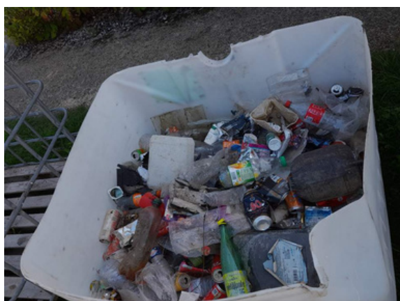
+ de 50 kg de déchets recueillis