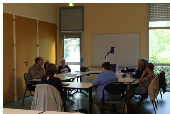
Séance de travail du groupe "bien vieillir" à Guichen, le 02 juin 2022