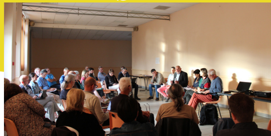
Réunion du 01 juin à Poligné

Suite à une demande faite en mars 2022 lors d'un théâtre forum portant sur l'installation-transmission, le conseil de développement a organisé une réunion d'information sur le rôle des structures accompagnatrices sur la thématique du foncier agricole : le CIVAM, la SAFER, Terre de liens et la Chambre d'agriculture. De très bons échanges se sont tenus lors de cette soirée d'information.